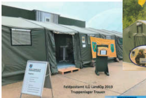
Feldpostamt ILÜ LandOp 2019 Truppenlager Trauen