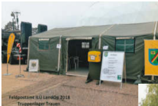
Feldpostamt ILÜ LandOp 2018 Truppenlager Trauen